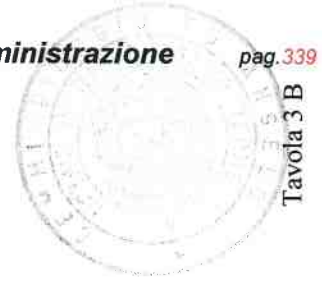
Tavola 3 B

Via Rigamonti, 65 - Darfo B.T. (BS) P. IVA e COD.FISCALE : 02349420980 Società controllata da Valle Camonica Servizi S.p.A. Iscritta al registro imprese BS al N.ro 2245000985